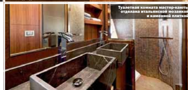
Туалетная комната мастер-каюты отделана итальянской мозаичной и каменной плиткой

В завершение можно продолжить тему «звездного дождя», пролившегося на Monte Carlo 65 с королем Бельгии Альбертом II, посетившим яхту в Каннах. И еще одно наблюдение: звезды каким-то удивительным образом расположились так, что с брендом, носящим имя Monte Carlo, связаны имена Карло Нуволари — партнера Дана Ленарда по дизайн-студии, занимавшейся этим проектом, и президента компании Карлы Демария. Во многом благодаря ее стараниям грандиозная программа реализуется столь быстро и успешно. Вот и говорите после этого про случайные совпадения! МВУ