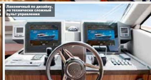
Лаконичный по дизайну, но технически сложный пульт управления