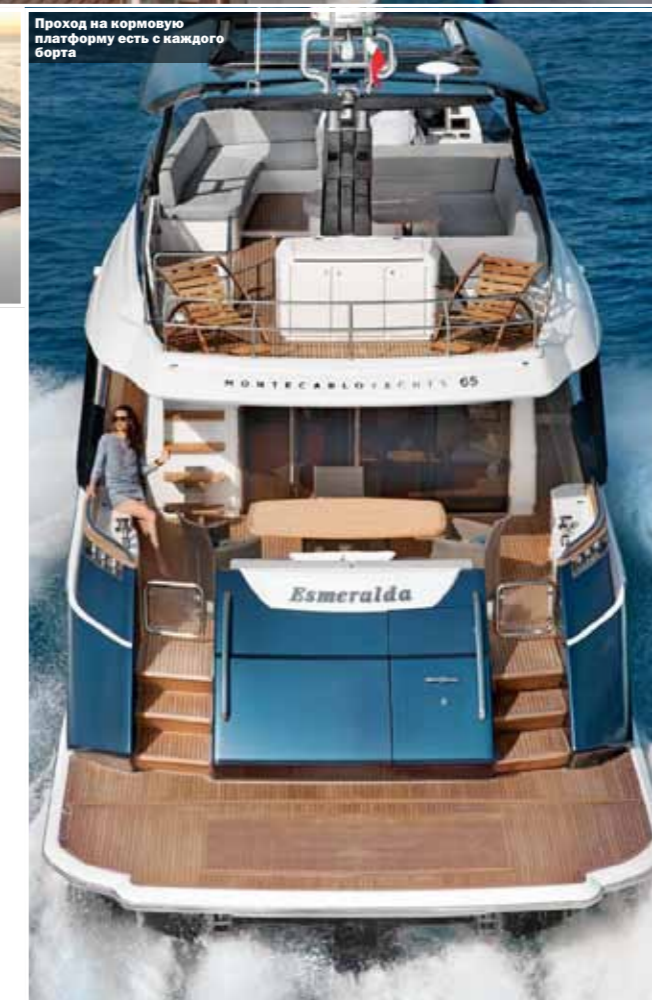
Проход на кормовую платформу есть с каждого борта

Т орговая марка Monte Carlo нам прежде была знакома по экспресс-круизерам французского бренда Beneteau с такой заметной особенностью, как аэрация днища. С недавних пор их стали называть Flyer Gran Turismo, а Monte Carlo теперь — это крупные моторные яхты, которые строит новая верфь Monte Carlo Yachts, расположенная в Монфальконе (Италия, северное побережье Адриатики). Верфь входит в холдинг Beneteau Group, но Monte Carlo — это уже самостоятельный бренд, хотя линейка пока состоит всего из двух моделей.