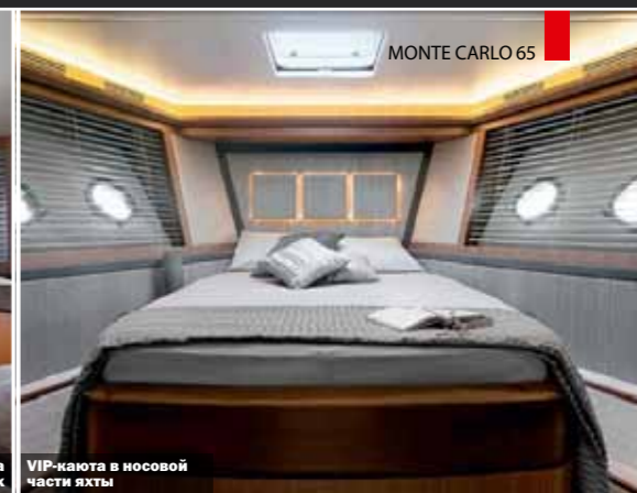
VIP-каюта в носовой части яхты