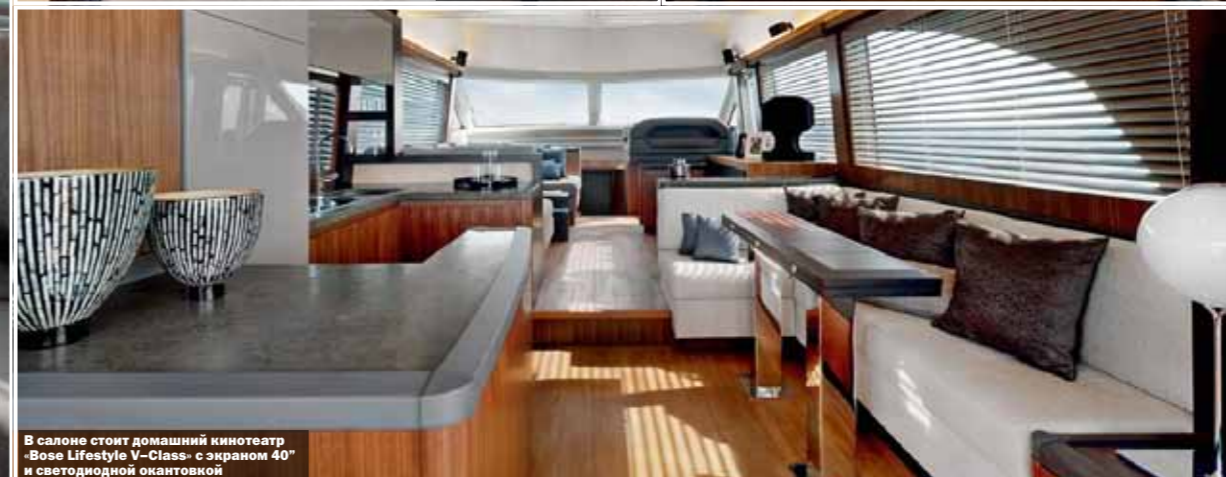
В салоне стоит домашний кинотеатр «Bose Lifestyle V-Class» с экраном 40" и светодиодной окантовкой

компанией ZF систему управления яхтой, интегрирующую управление двигателями и подруливающими устройствами при помощи джойстика (штурвал, само собой, присутствует). А еще полезная вещь — рядом с пультом по правому борту находится водонепроницаемая снабженная электроприводом дверь на палубу.