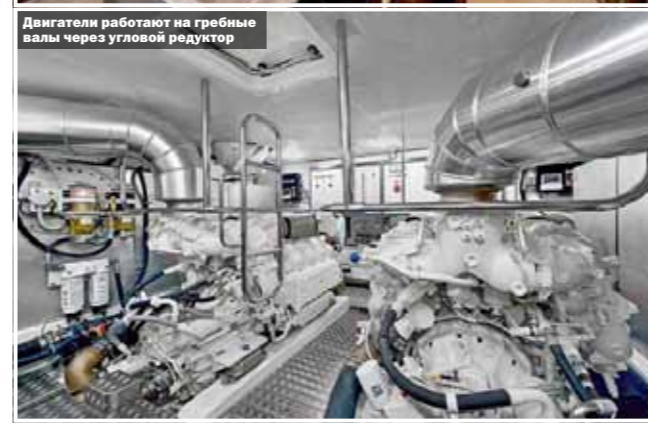
Двигатели работают на гребные валы через угловой редуктор