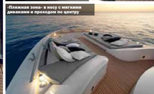
«Пляжная зона» в носу с мягкими диванами и проходом по центру