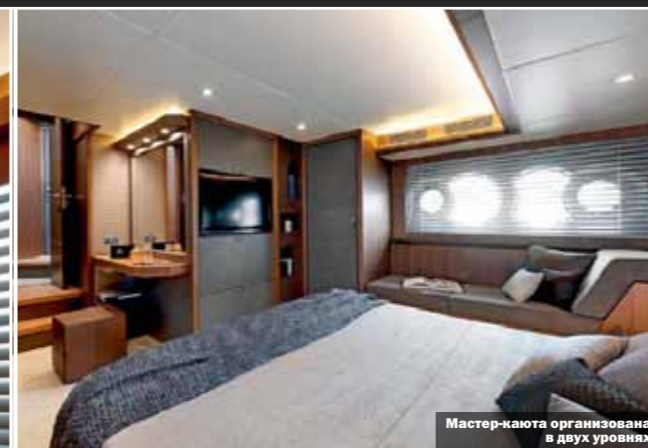
Мастер-каюта организована в двух уровнях