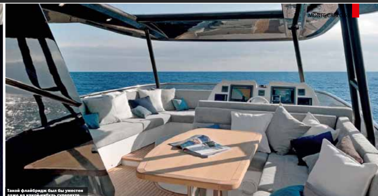
Такой флайбридж был бы уместен даже на какой-нибудь суперяхте

Защищенный сверху свесом флайбриджа кокпит служит отличным местом для завтрака al fresco и просто для отдыха с видом на море